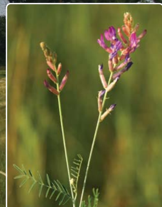
A Tápió-vidék egyik legritkább homoki növénye, a homoki csüdfű