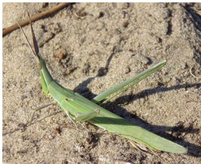
Ma már gyakorinak számító védett egyenesszárnyú, a sisakos sáska