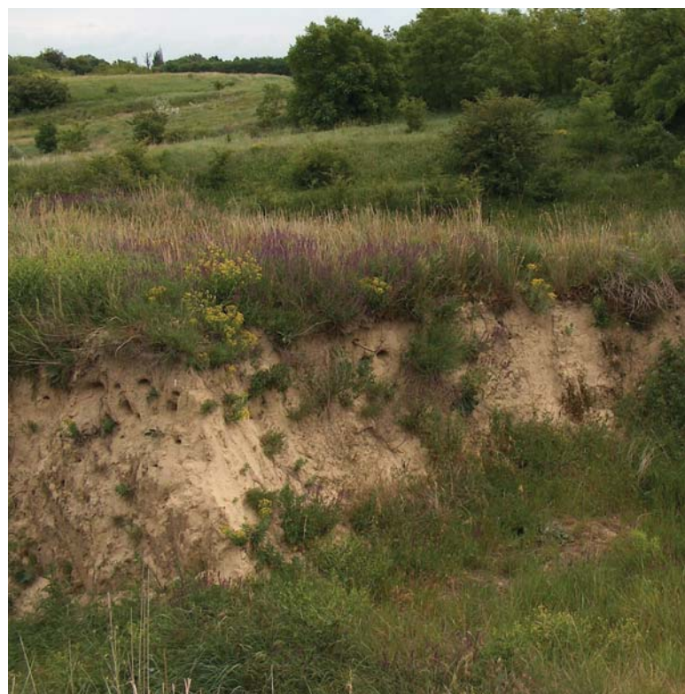
Fajgazdag löszgyep a Földvár tetején

Sajnos napjainkban a tápiósági Földvárra számos, jórészt ember által előidézett veszély leselkedik. Ilyen a szomszédos szántók irányából bemosódó nagy mennyiségű műtrágya- és vegyszermaradvány, ami az értékes növényzet lassú átalakulását, gyomosodását idézi elő. Hasonlóan súlyos probléma a korábban oly jellemző legeltetés megszűnése, melynek eredményeként a cserjefajok látványos előretörése figyelhető meg. Igazgatóságunk a „Szárazgyepek megőrzése Közép-Magyarországon” című LIFE+ pályázat keretében próbálja ezeket a negatív folyamatokat megállítani. Ebben az évben megtörtént egy hektárnyi szántódarab visszagyepesítése, illetve jövőre indul a terület egészét érintő gépi és kézi cserjeirtás. A szemléletformálás részeként felújításra kerül az immár tíz éves Gólyahír tanösvény, melynek egyik állomása a Földvár legmagasabb pontján helyezkedik el.