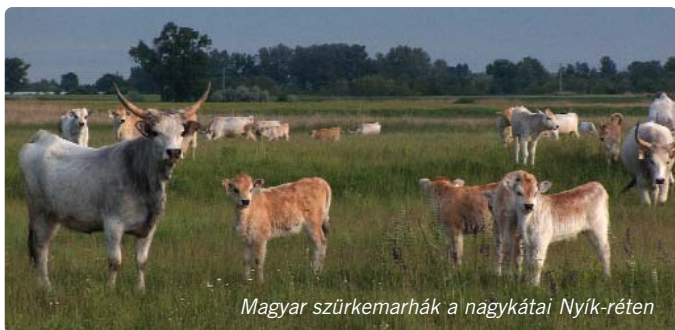
Magyar szürkemaráhák a nagykatái Nyík-réten