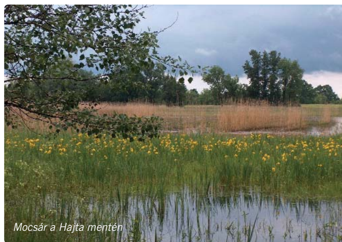
Mocsár a Hajta mentén