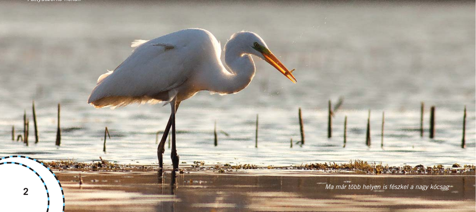
Ma már több helyen is fészkel a nagy kócsag