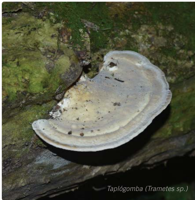
Taplógomba (Trametes sp.)