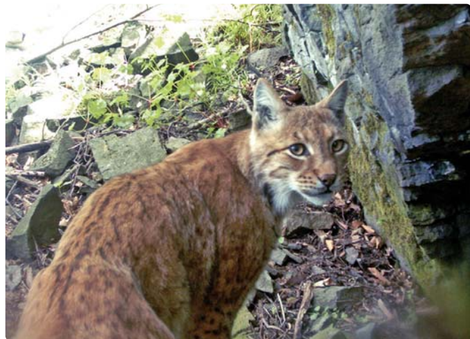
Kameracsapdás felvétel a hiúzról

Hazai jelenléte bizonyítja, hogy hegységünk erdei milyen felbecsülhetetlen értéket képviselnek mai világunkban. Így kapta a Királyréti Erdei Iskola és Látogatóközpont a nevét e csodálatos állat után. A Hiúz Házban küldetésünknek érezzük, hogy a tudás és a természetszeretet Börzsönyi bázisa legyen. Egész éves tevékenységünk és szolgáltatásaink célja, hogy a gyerekek és a felnőttek megismerjék, megszeressék, magukénak érezzék és óvják sérülékeny helyi értékeinket.