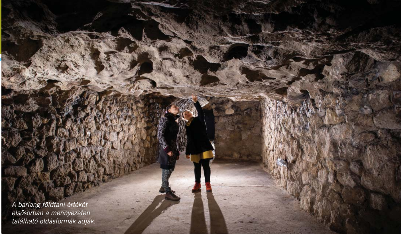
A barlang földtani értékét elsősorban a mennyezetén található oldásformák adják.