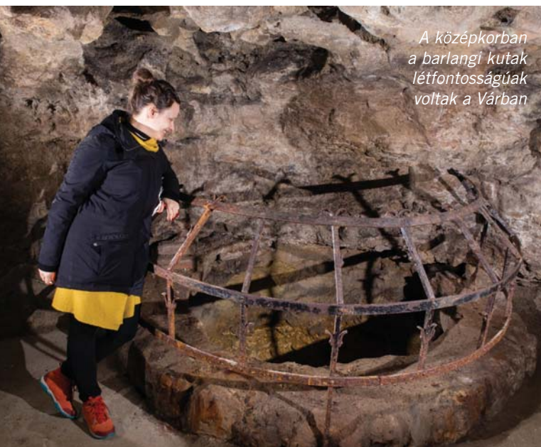
A középkorban a barlangi kútak létfontosságúak voltak a Várban

Az eredeti barlangüregek kialakulása a jégkorszak idején itt feltörő meleg vizű forrásoknak köszönhető. A források vizéből előbb egy 8-10 méter vastagságú édesvízi mészkőréteg rakódott le, majd később ugyanez a hévizes forrás-tevékenység a mészkőréteg aljából kisebb-nagyobb barlangokat oldott ki. Mivel az üregeknek nem volt természetes bejáratus, megtalálásuk legtöbbször valószínűleg kútásásnak volt köszönhető. Ezeknek a kutaknak óriási szerepük volt a Várhegy betelepülésében, mivel geológiai adottságai miatt itt könnyebb volt ivóvízhez jutni, mint például a szomszédos Gellért-hegyen.