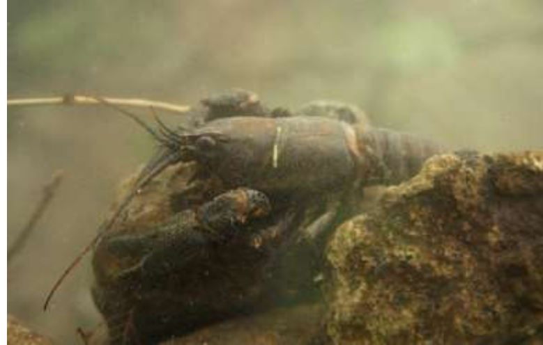
Kövi rák