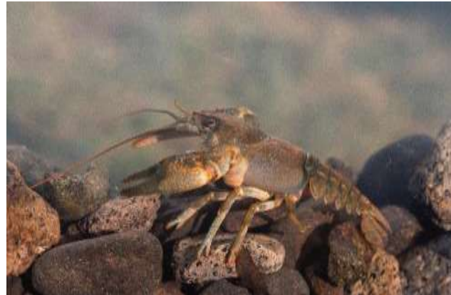
Kövi rák, fotó: Szelényi Gábor

Mindhárom faj védett. Természetvédelmi eszmei értékük 50 000 forint.