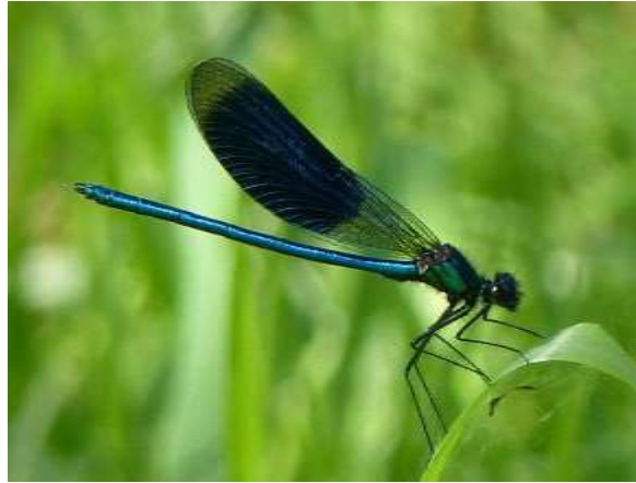
Sáros szitakötő , a kis szitakötőkhöz tartozik