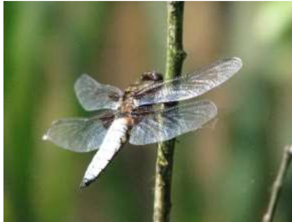
Közönséges acsa , a nagy szitakötőkhöz tartozik