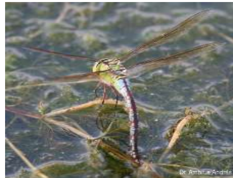
Petéző óriás szitakötő

Óriás szitakötő