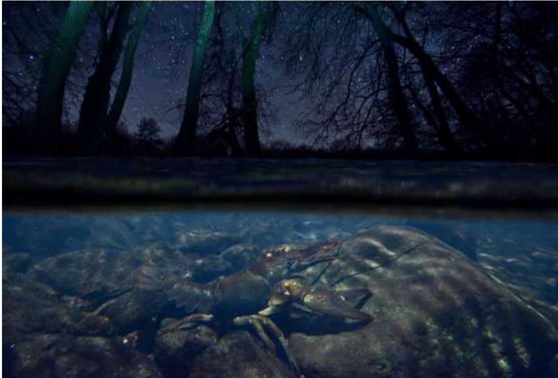
Kövi rák a Börzsönyben

További érdekes információkat találtok a Hiúzház blogon