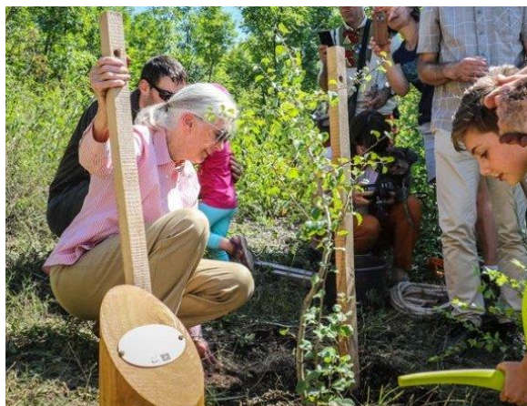
Jane Goodall facsemetét ültet a Sas-hegyen

„Minden egyes apró cselekedet számít. Minden egyes nap, minden egyes percében bárki tehet valamit azért, hogy jobb legyen a világ” mondta Jane Goodall, miután 2019 augusztusában gyerekek részvételével őshonos facsemetéket – házi berkenyét, vadvadkörtét és molyhos tölgyet – ültetett el a „Kutyafuttató” területén. Ez a faültetés egy hosszú távú természetvédelmi munka legelső lépése.